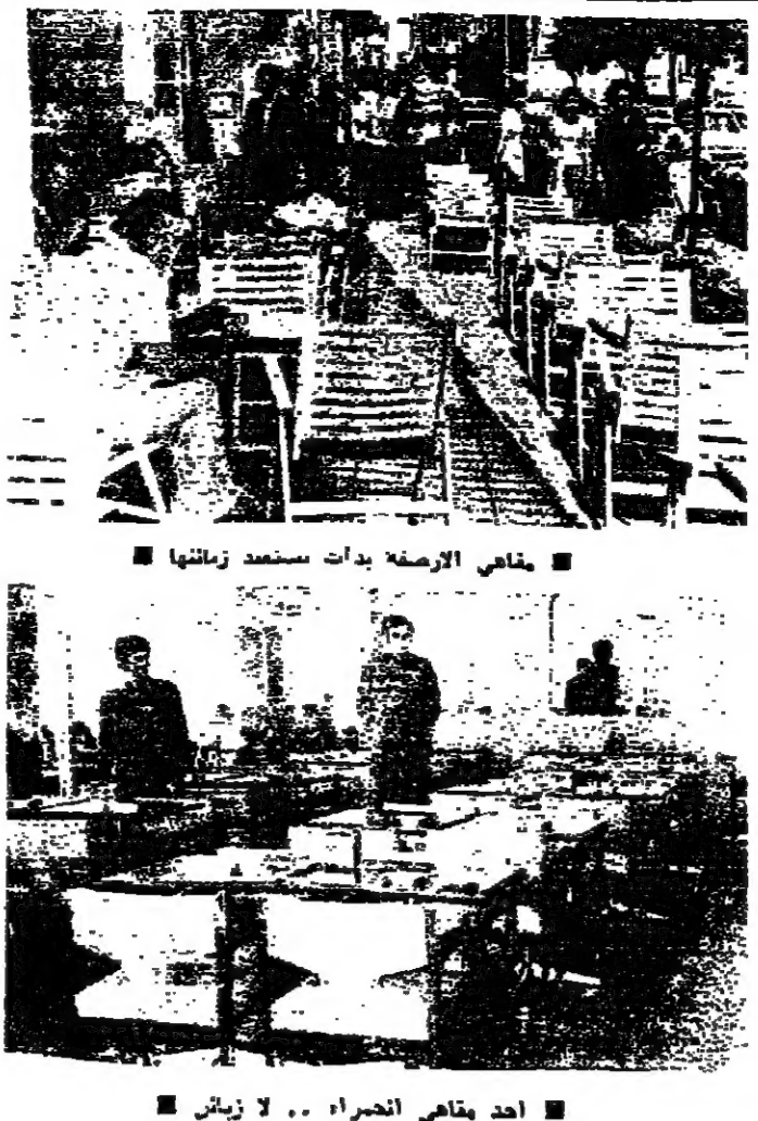
أحد مقاهي الحمراء .. لا زبائن